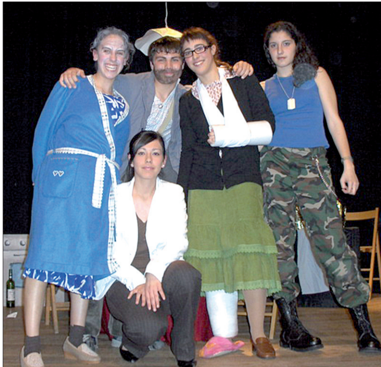
Grupo de teatro Carcoma, en su actuación ¡Anda mi madre!

Todo un plantel de jóvenes artistas que llenarán este mes Carvajosa. Se cierra el telón.